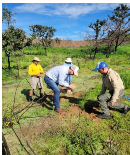
Fig. 3 Actividades de reforestación en los municipios de Mascota y Talpa de Allende con presencia de los alcaldes.