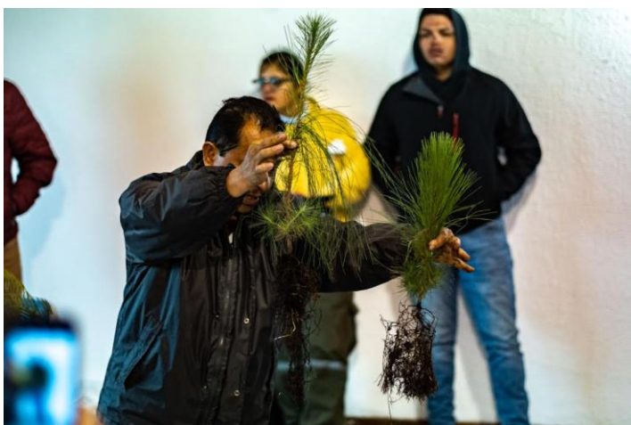
Fig. 2.- Actividades realizadas durante la capacitación en el Parque Nacional Nevado de Colima.