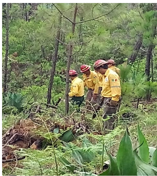
Fig.4.- Actividades de rehabilitación de caminos accesos, acordonamiento de material y estabilización de cárcavas en los municipios de Cabo Corriente y Talpa de Allende.